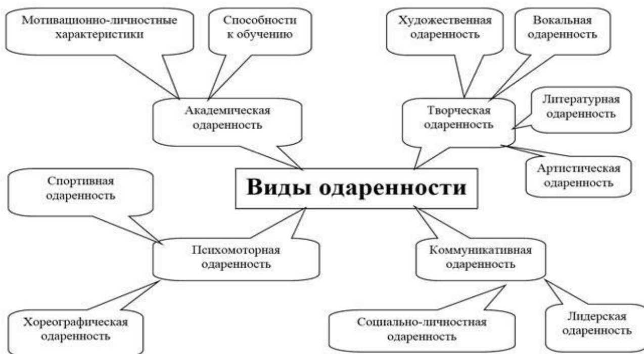
Схема № 1 «Виды одаренности в зависимости от вида предпочитаемой деятельности»

Более подробно виды одаренности в зависимости от вида предпочитаемой деятельности показаны на схеме № 1 и в таблице № 2.